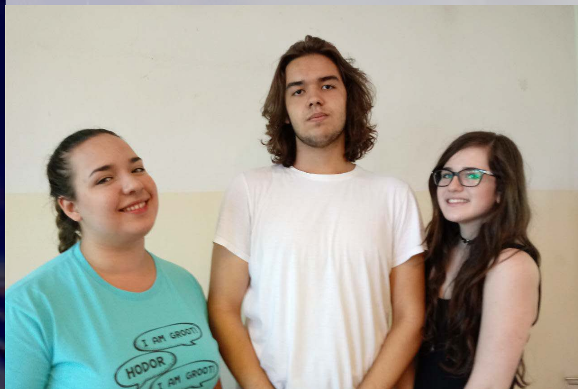
Hidraulikus konduktivitás fás szárúakban