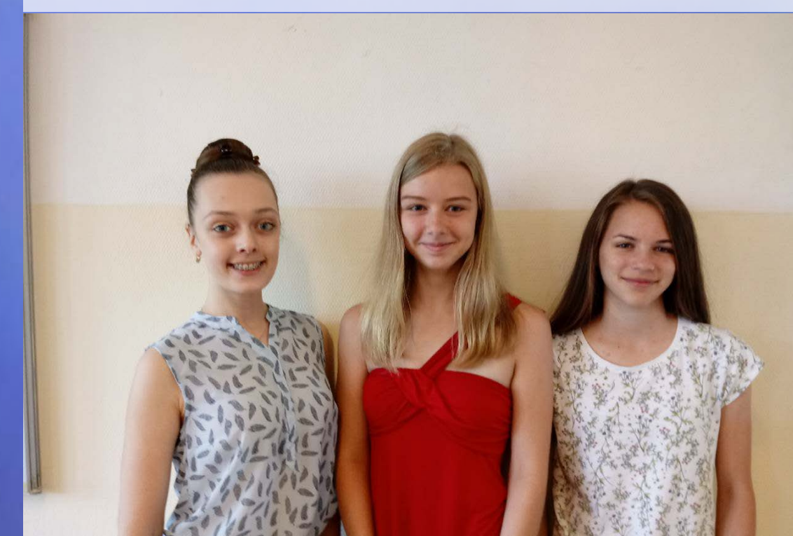
Az ozmózis és a diffúzió